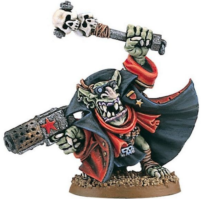
Gobbo le Rouge