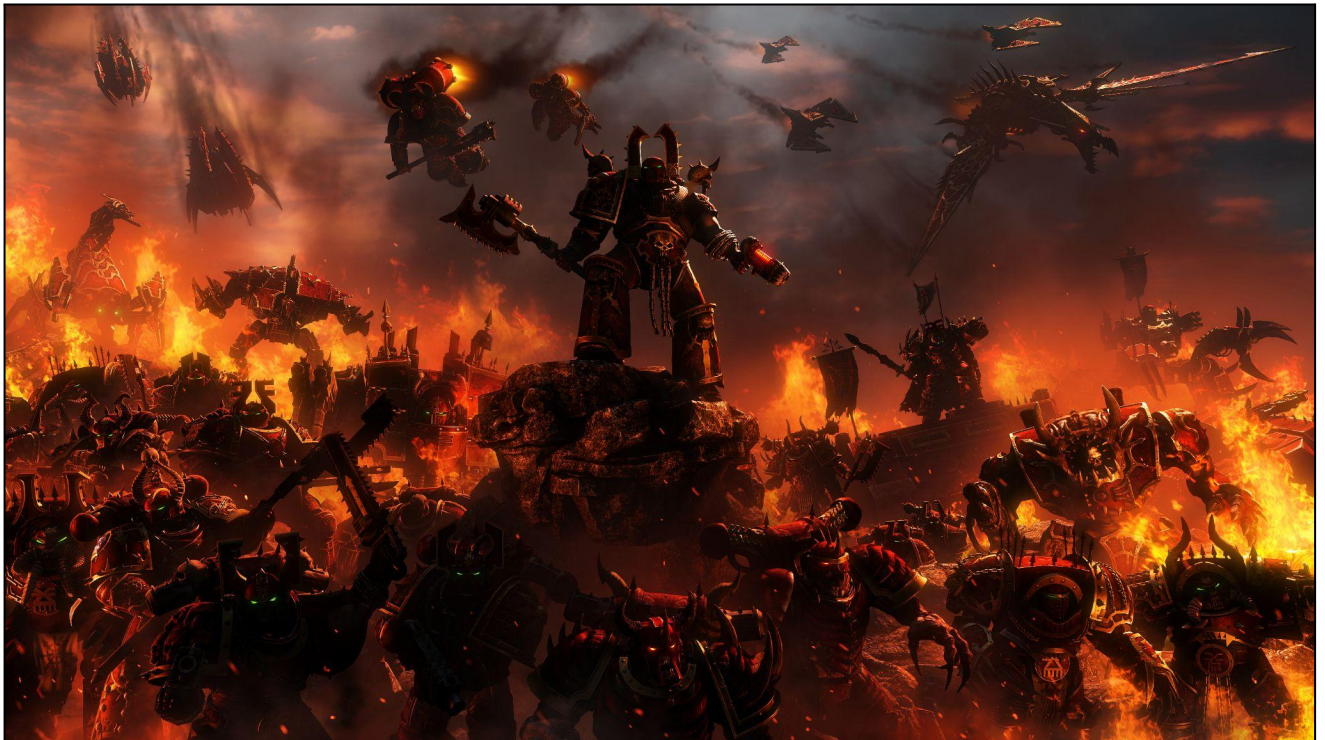
Legion World Eaters déferlant sur un monde impérial (date et lieu inconnus).

Si plusieurs formations utilisent des Modules d'atterrissage , placez tous les marqueurs Module d'atterrissage aux coordonnées prédéterminées en utilisant les règles d'Assaut Planétaire (y compris la résolution de dispersion). Une fois que tous les marqueurs sont placés, résolvez toutes les attaques des Modules d'atterrissage simultanément contre les formations ennemies à portée des marqueurs Module d'atterrissage . Les formations visées recevront un pion impact pour le tir pour chaque attaque du vaisseau ou des modules d'atterrissage. Les pertes et les tirs ruptures infligent des PI normalement. Puis débarquez toutes les formations transportées, en suivant les règles ci-dessus.