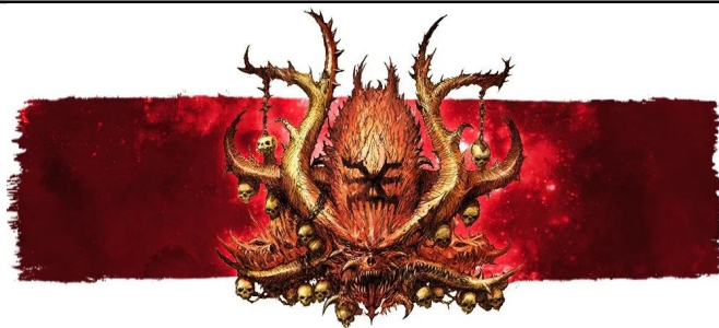
Icône de Khorne

Les unités Instables démoralisées sont immédiatement détruites. De plus, les unités Instables ne peuvent que contester les objectifs, pas les contrôler.